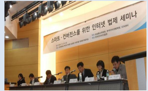
스마트 컨버전스를 위한 인터넷 법제