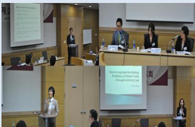
제 2 회 신진학자 발표회