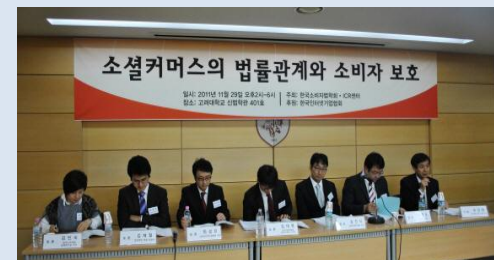
소셜커머스의 법률관계와 소비자보호