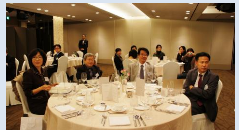
ICR 센터 연구위원