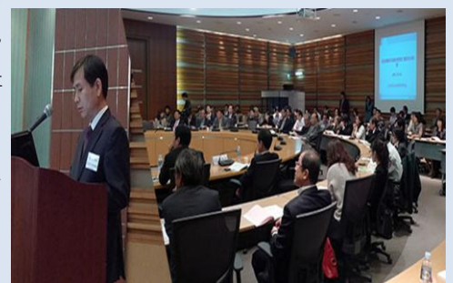
삼성/애플 특허분쟁의 배경 및 경위