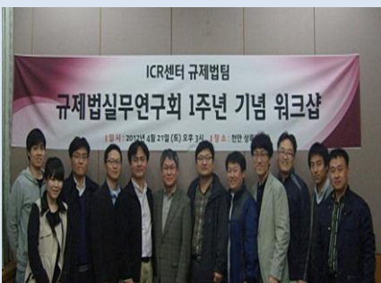
규제법 실무연구회 1 주년 워크샵

ICR 센터 규제법실무연구회가 창립 1 주년을 맞이하여 상록리조트에서 제 11 회 정기발표회 및 1 주년 기념 워크샵을 가졌다. 정기 발표회에서는 '참여와 협력에 의한 행정의 법문제', '하천편입 토지 보상과 행정법상 유추' 등에 대한 주제 발표에 이어 심도있는 토론이 이루어졌다. 정기발표회에 이어진 워크샵에서는 연구회 창립 1 주년을 돌이켜보고, 앞으로의 발전방향에 대해 구성원간의 의견을 나누는 시간을 가졌다.