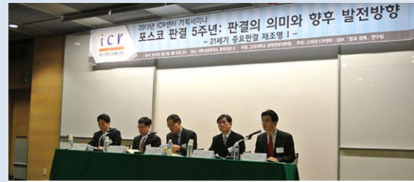
포스코 판결 5 주년:판결의 의미와 향후 발전방향