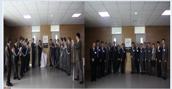
ICR 센터 현판식