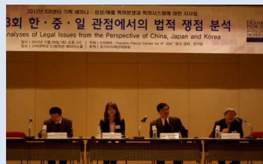
제 3 회 삼성/애플 세미나: 한·중·일 관점에서의 법적 쟁점 분석