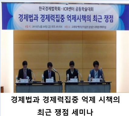
경제법과 경제력집중 억제 시책의 최근 쟁점 세미나