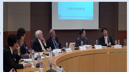
제 1 회 삼성/애플 세미나